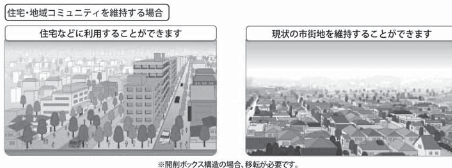
図1 『たたき台』で示された「住宅・地域コミュニティを維持する場合」

PIという概念についてはいまだ定義が確定的ではないとされるが（藤井・矢嶋・羽鳥・岩佐 2008）、国土交通省は「市民等の多様な関係者に情報を提供した上で、広く意見を聴き、政策や計画の立案に反映するプロセス」という包括的定義を示している（国土交通省道路局 2006）。外環道計画におけるPIでは、このプロセスが複数の並行的な手法により進められてきた。その中でも代表的なものが、国交省・東京都・沿線区市といった行政と外環道をめぐる何らかの活動を行ってきた沿線住民の協議体である「PI外環沿線協議会」（以下「PI協議会」）であり、またPI協議会が名称を変えて継続的協議体となった「PI外環沿線会議」（以下「PI会議」）である。PI協議会およびPI会議はPIプロセス全体を事実上統括する機能を有しており、そこで議論された内容が計画検討にどのように反映されるかが重視されたことは間違いない。