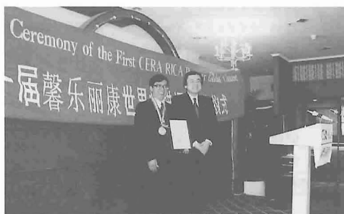
図1 世界蜜蠟コンテストの表彰式 (中国・北京市内で)

私たちは、現代産業に応用できる蜜蠟の開発・生産に必要な機能性蜜蠟原料を開発し、世界養蜂業の発展を促進することを願って、蜜蠟